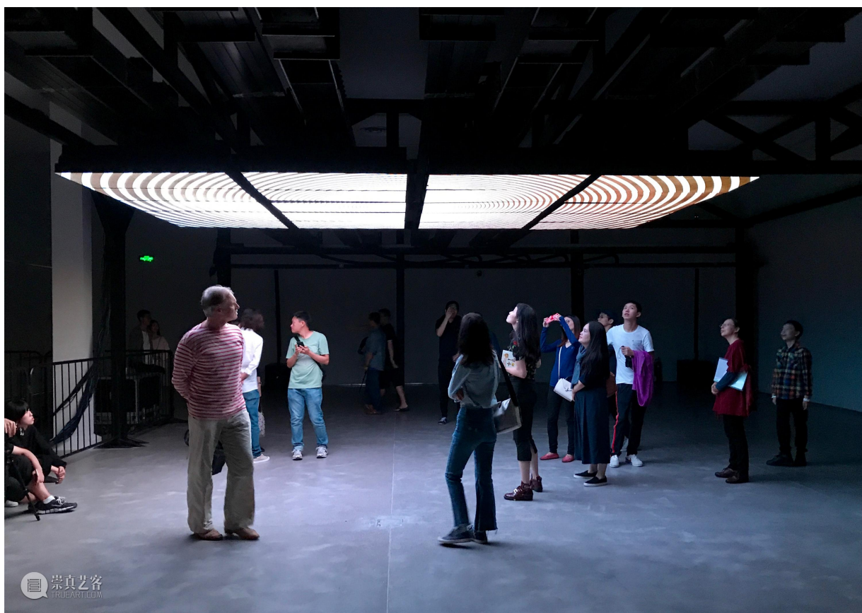
张鼎《漩涡》，展览现场