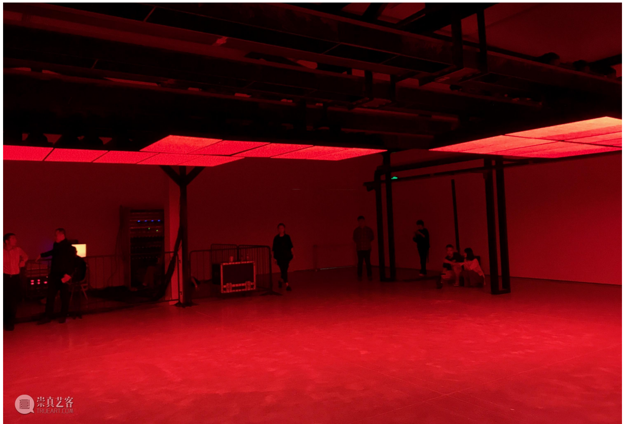
张鼎《漩涡》，展览现场