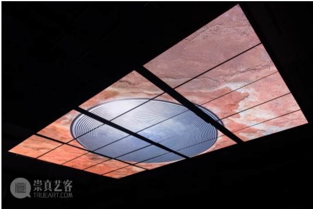
张鼎《漩涡》，展览现场

时隔三年，张鼎再次回到画廊空间，在香格纳上海制造了这个巨大的漩涡。据悉，展览将持续至10月27日。