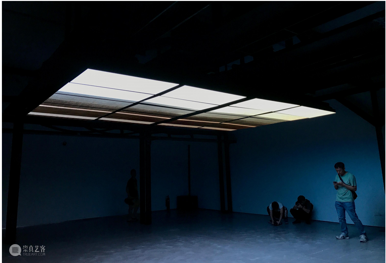
张鼎《漩涡》，展览现场