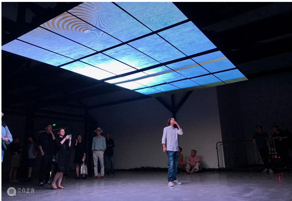
张鼎《漩涡》，展览现场